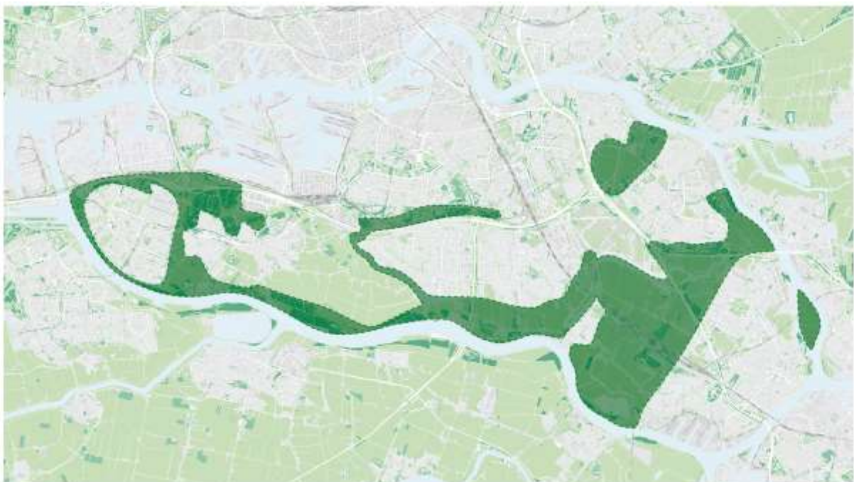
Contouren groene ruimte van de Landschapstafel IJsselmonde